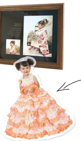
アクリルスタンド